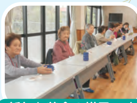
新年お茶会の様子です