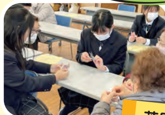
折紙で特別な 鶴づくり