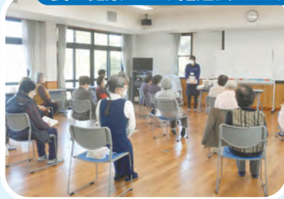
食と健康づくり推進会による講話と体操の様子です