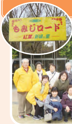
お出かけサロン・道の駅保田小学校