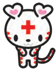
日本赤十字社公式 マスコット・キャラクター 「ハートちゃん」 https://www.chiba.jrc.or.jp