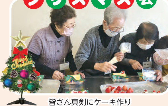
皆さん真剣にケーキ作り