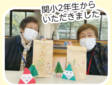
関小2年生から いただきました