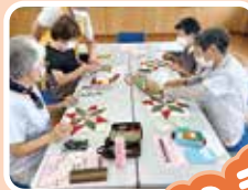
クリスマスリース作り