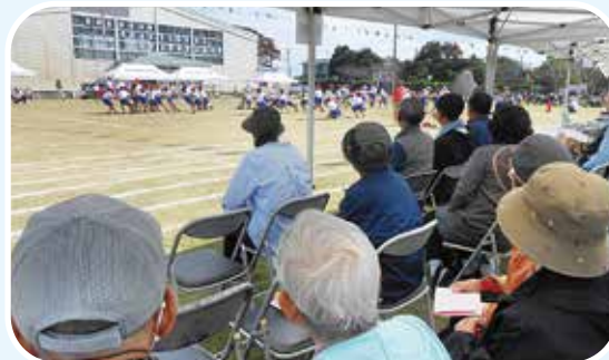
紅組・白組両組気合い入ってます

★ 南白亀小学校運動会高齢者招待 (10/14) ★ 小学生の活躍にとっても楽しんで頂けました