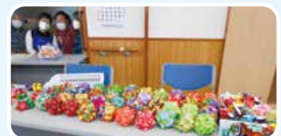
かわいい手作りのおみやげです