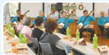
津軽三味線最高でした!