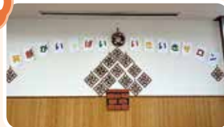
夢サロンで作ったクリスマスリースがツリーに！