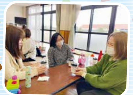
▲ティータイム & 情報交換