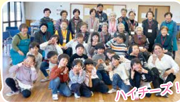
関小2年生とアイデア出し合い干支カレンダー作り