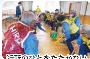
近所のひとをたたかないように頑張ってます!