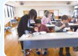
ストローを使って上手に!