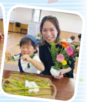
▲フラワーアレンジメント