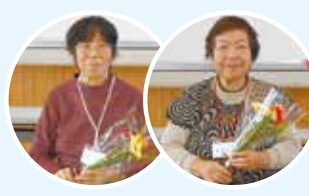
おめでとうございます!