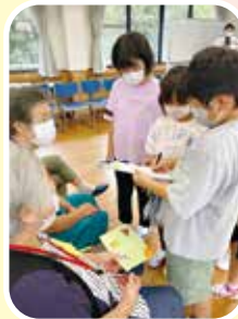
関小3年生と輪投げの集計をいっしょに