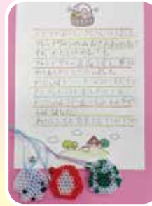
子ども達からお礼の手紙とプレゼント