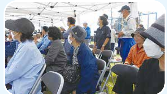
皆さん集中して見守っています