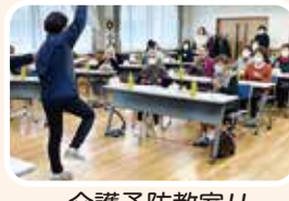
介護予防教室!! 認知症予防体操