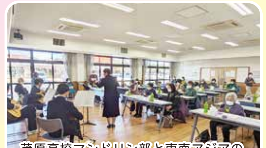
茂原高校マンドリン部と東南アジアの竹楽器で合奏し、一体感が生まれました♡